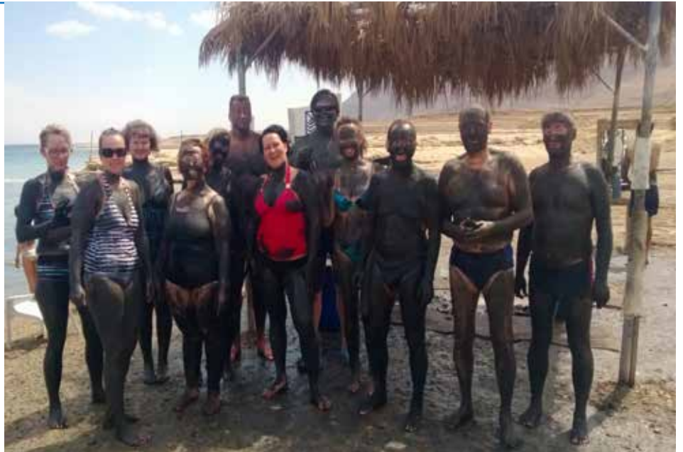
Kuolleella merellä oli mahdollisuus mutakylpyyn ja...

Lähdimme klo 8.30 tutustumaan Au- tuuden vuorelle, Pietarin kalasatamaan,