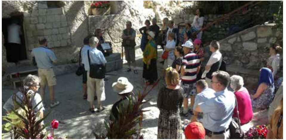
Puutarhahaudalla käynti oli elämys.