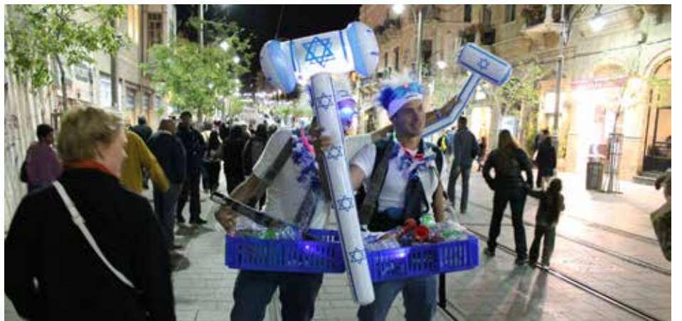
Israelin 65-vuotis itsenäisyyspäivää juhlittiin riehakkaasti ilman alkoholia.