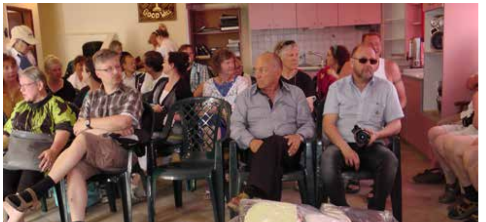
Golanilla vierailtiin Huumevieroituskeskusissa.