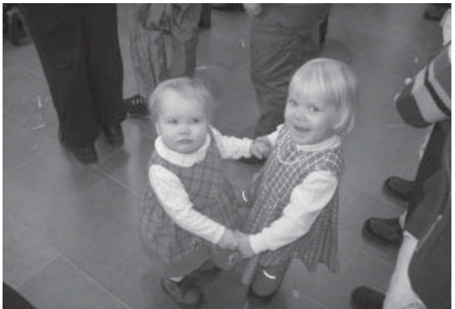
Päivien nuorimmat osanottajat esittivät piirileikkiä.