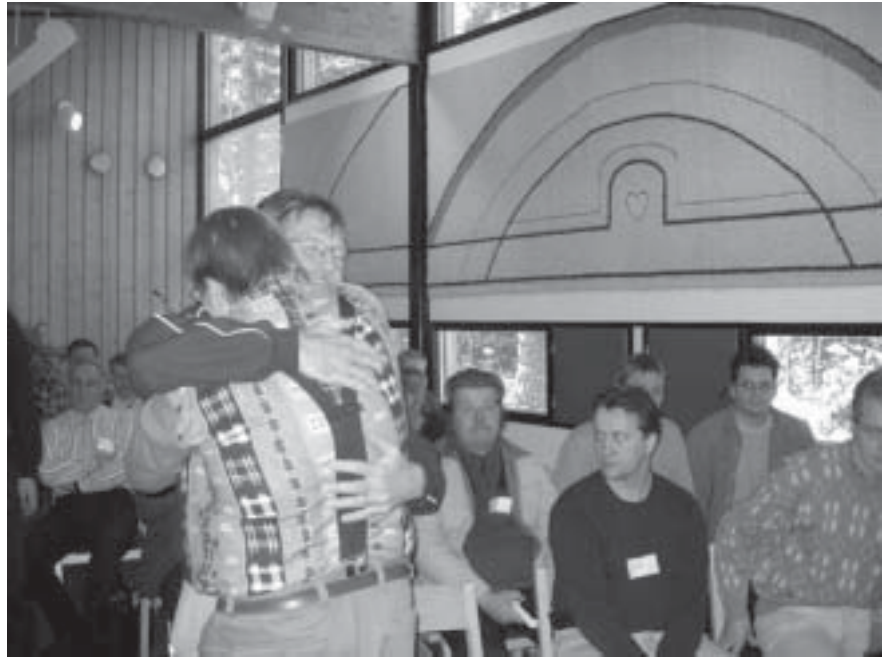
Miesseminaarissa opeteltiin kertomaan tunteista ja osoittamaan tunteita miehisellä halauksella.

“Korintissa oli uskoa ja armolahjoja, mutta seurakuntalaisilla seksuaalisuuteen liittyviä suuria ongelmia. Kaikki ongelmat eivät yksinkertaisesti poistu uskoon tulon myötä. Kaikkia meitä