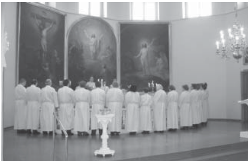
Katulähetystyöhön Vammalassa siunattiin yhteensä 17 vapaaehtoistyöntekijää.