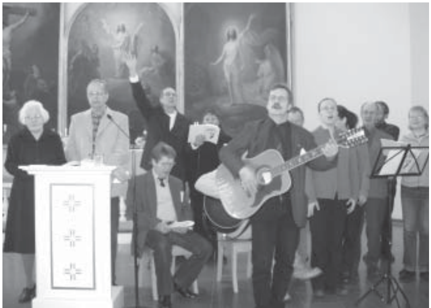
Päivillä veisattiin ja laulettiin sekä ylistettiin Herraa.