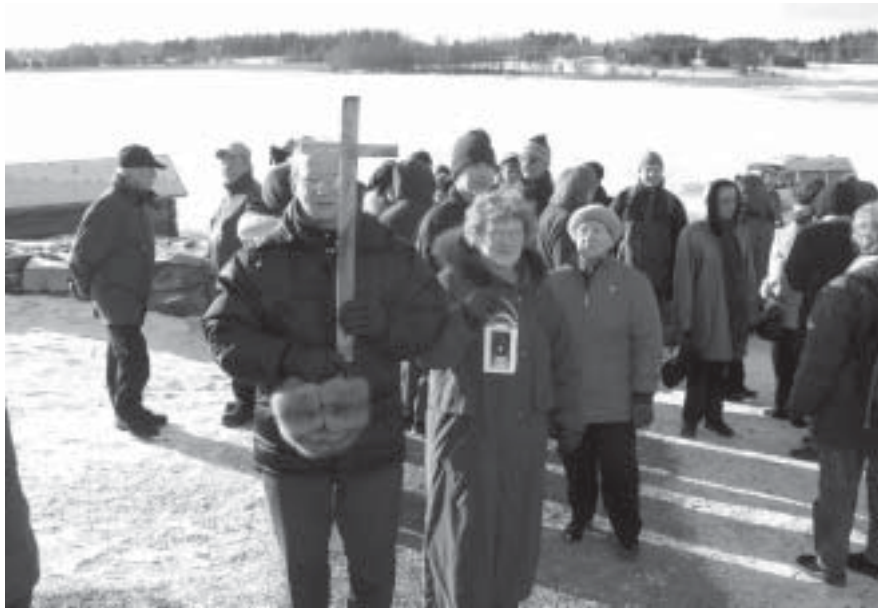
Juhlava joukko teki vaelluksen seurakuntakeskuksesta neljän kilometrin päässä sijaitsevalle keskiaikaiselle Pyhän Olavin jälleenrakennetulle kirkolle.

Jumalan Sana ja hengelliset laulut juuri siellä missä on mahdollista kertoa toiminnastamme ulkopuolisille tuntuu todella hyvältä ja oikeaan osuneelta ratkaisulta. Seurakunnan, paikallisen katulähetystyön, Katulähetysliiton ja kaupungin edustajat toivat samassa rintamassa tervehdyksensä Torikeskuksen aulaan kokoontuneelle runsaalle yleisölle. Tämän jälkeen oli hyvä jatkaa päiviä seurakuntatalossa. Perjantai-illan tilaisuus muodostuikin siellä siunatuksi kohtaukseksi, jossa eri kaupunkien edustajat kertoivat työn iloista ja haasteista. Jyväskylästä oli tällä kertaa kymmenhenkinen joukko mukana. Saimme tuoda lämpimät terveiset sekä lauluin että todistuspuheenvuoroin.