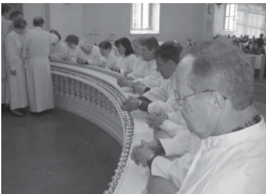
Tulevat kesän katulähetyspäivät pidetään heinä-elokuun vaihteessa Rovaniemellä.