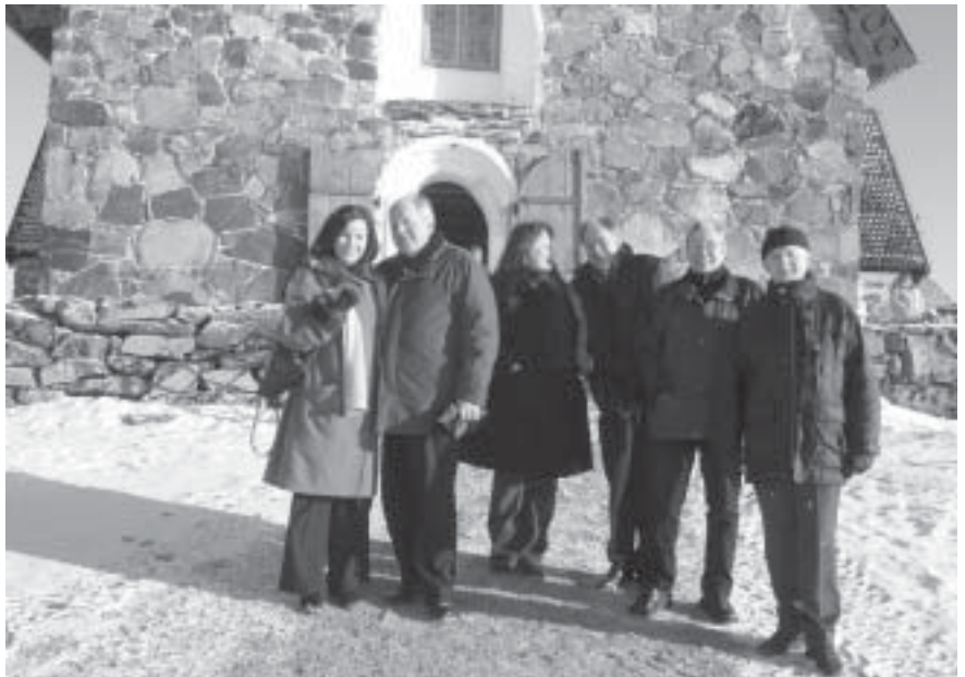
Jyväskyläläiset Pyhän Olavin kirkon edustalla.

Sunnuntaiaamuna Tyrvään kirkossa pidetyn Messun yhteydessä siunattiin seitsemäntoista uutta veljeä ja sisarta katulähetystyön hyvin haasteelliselle peltosaralle. Ihmetys ja kiitollisuus nousi kirkossa siitä, että Jumala on voimallinen kutsumaan ja asettamaan vuosi vuodelta aina vain uusia ihmisiä tähän työhön, jota harvoin suurissa otsikoissa mainitaan. Se kertoo myös siitä yhteiskunnallisesta kehityksestä, että kaikki eivät jaksa kiristyvässä kilpailussa vaan putoavat elämän suopaikkoihin. Monet siunatuista ovat sen