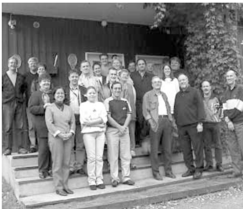
Näky tarvitsee tekijänsä: uusien työmuotojen kehittyessä on Jyväskylän Katulähetyksen työntekijämäärä vuosi vuodelta kasvamassa.

Vuoden 2000 aikana yhdistys antoi eripituisen työmahdollisuuden yli sadalle pitkäaikaistyöttömyydestä kärsivälle ihmiselle. Yhdistyksessä halutaan tuntea vastuuta työntekijöistä myös työllistämiskätsotään jälkeen. Parhailaan kehitetään koulutusohjelmaa, jonka kautta työssä olevat henkilöt saisivat valmiuksia elämänsä myös vuoden pituisen työllistämistyökätsotään jälkeen.