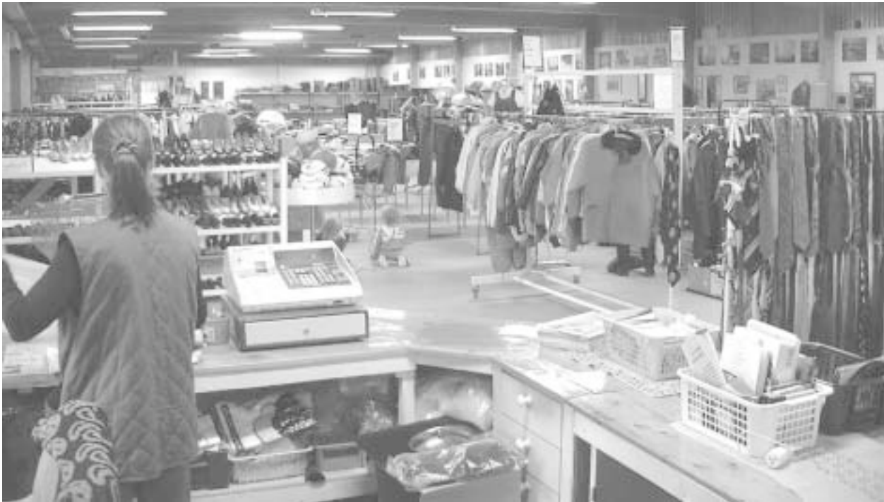
Sieltä ostetaan, mistä halvimalla saadaan – tietysti Kankitien kierrätyskeskuksen kirpparilta.

● Työ on nykyihmisellekin tärkeä, onhan se Jumalan säätämä alusta asti. Työ tuo sisällön ja mielekkyyden elämäämme, Jumala-suhteen ja ihmissuhteiden sekä yksityisen lepoaikamme ohella. Työllämme voimme palvella Jumalaa ja lähimmäistämme käytännössä! Katulähetyksen kierrätys- ja työllistämisyksikkö EkoCenter Jyka Tuote Kankitiellä tarjoaa useille ihmisille mahdollisuuden mielekkääseen työhön ja elämän sisältöä.