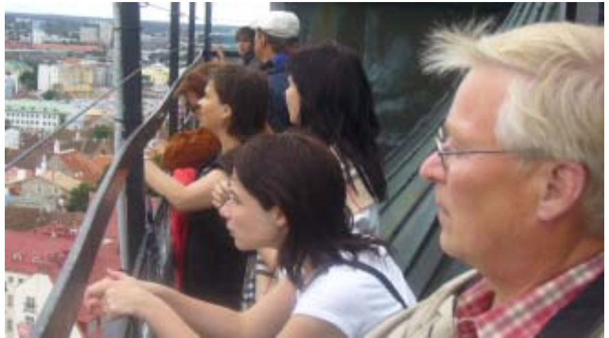
Olavisten kirkon tornista näkyy koko kaupunki yli 120 metrin korkeudesta.