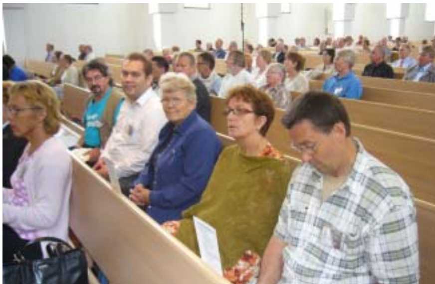
Jyväskylän katulähetysväkeä Seinäjoella.

Seuraavat Katulähetysliiton talvipäivät pidetään Porissa 8.-10.2.2008.