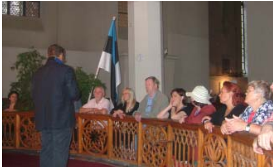
Alttarihetki Olavisten kirkossa.