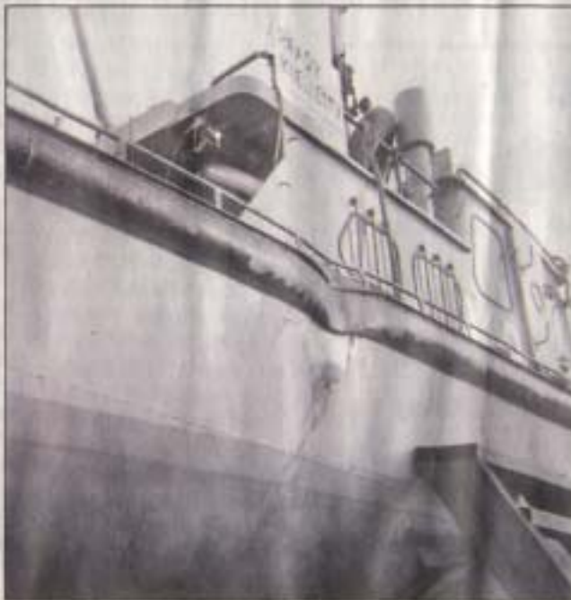
K8 sai törmäyksessä vain pienen painuman oikeaan kylkeensä. Törmäyskohta oli 4,15 metrin päässä veneen perästä.

Monnan hautasumalle kerääntyi 5000 ihmistä saattaamaan K8:n onnettomuuden uhreja joukkohautaan. Omaiset kokivat, ettei heidän suruaan ja yksityisyyttään kunnioitettu, vaan he jäivät valtavan yleisömassan jalkoihin.