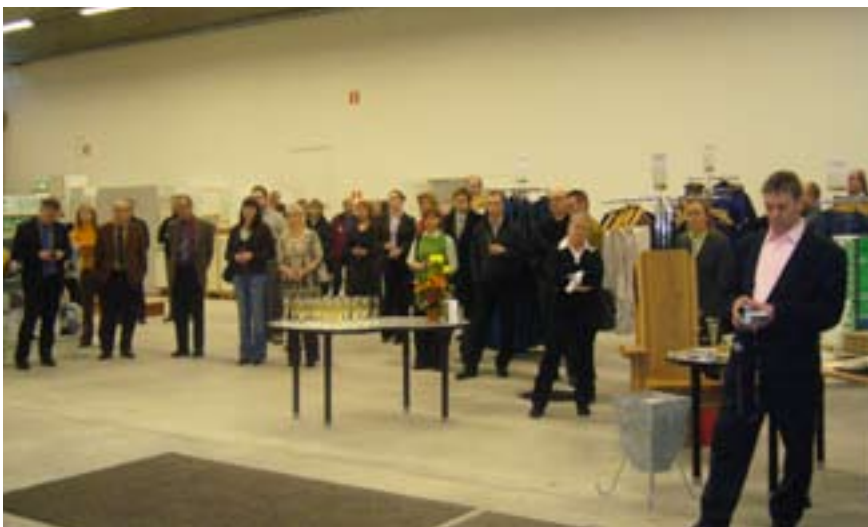
Kutsuvieraita Ekocenter Raksan avajaisissa.