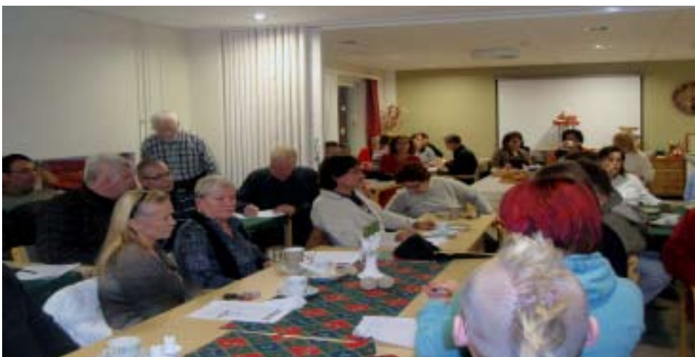
Vuosikokous pidettiin uuden raksahallin lounaskahvilatiloiissa.