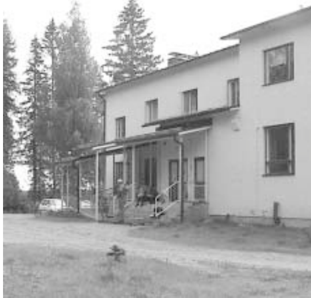
Tessio Backan kohderyhmänä ovat erilaisista riippuvuuksista kärsivät lähimmäiset.

Kuntoutuminen tapahtuu arjen työtehtävien, ryhmätoiminnan, kahdenkeskeisten/ sielunhoidollisten keskustelujen, liikunta/ elämysten avulla ja Tessio Backassa on mahdollisuus osallistua hengellisiin tilaisuuksiin. Itsenäistymiskeskukseen tulevat asiakkaat sitoutuvat sinne tullessaan kirjallisesti talon ohjelmaan sekä itsenäistymiskeskuksessa oloaikanaan päihdeettömyyteen. Tessio Backassa on myös mahdollisuus kalastaa, käydä sienessä ja marjassa, sekä hoitaa hevosta, kanoja, koiraa ja kissaa.