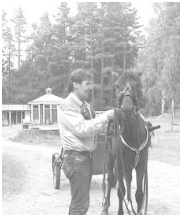
Tessio Backassa asiakkailla on mahdollisuus osallistua myös hevoshommiin.

Tessio Backan maalaismaisemassa viihtyvät hevoset, joita nyt on talossa kolme kappaletta. Harjatukat ovat saaneet asiakkaistamme innokkaita hoitajia, ajajia ja ratsastajia. Jopa harjaamiset ja tallin siivoamiset sujuvat mallikelpoisesti. Aina välillä pyritään tekemään myös kilpailumatkoja jollekin paikkakunnalle koko porukalla. Tällä hetkellä Tession seitsemästä asiakkaasta viisi osallistuu aktiivisesti hevoshommiin.