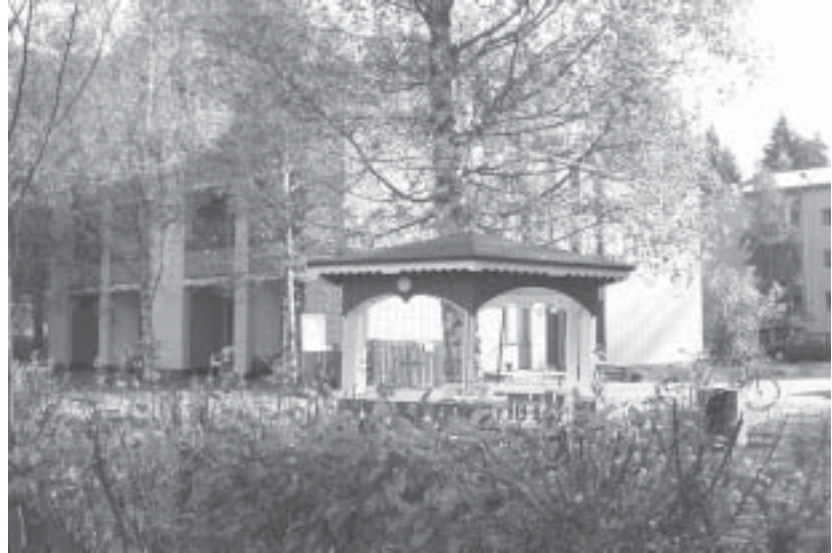
Köhniöntie 2:n kiinteistö jatkaa lähes entisessä tehtävässään, sillä se toimii tänään vielä kaupunkiseurakunnan ylläpitämänä syrjäytyneiden asumisyksikkönä.

Uusien asumisyksikköjen etsintä näin ollen jatkuu, sillä Jyväskylän Katulähetys on ottanut ehdottomaksi tavoitteekseen taata jokaiselle jyväskyläläiselle päihdeongelmalliselle katto pään päälle. Ensimmäinen paikka monelle on juovia alkoholisteja syliinsä sulkeva, Kankitie 11 sijaitseva, Ensiaskeleita. Tästä sylistä voi