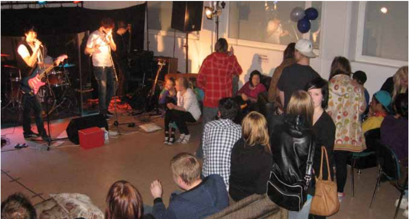
Nuorisotalon Aprilnight -iltatapahtuma. Kuvassa talon nuoria, sekä the Dinosaurs -bändi Vimpelistä.