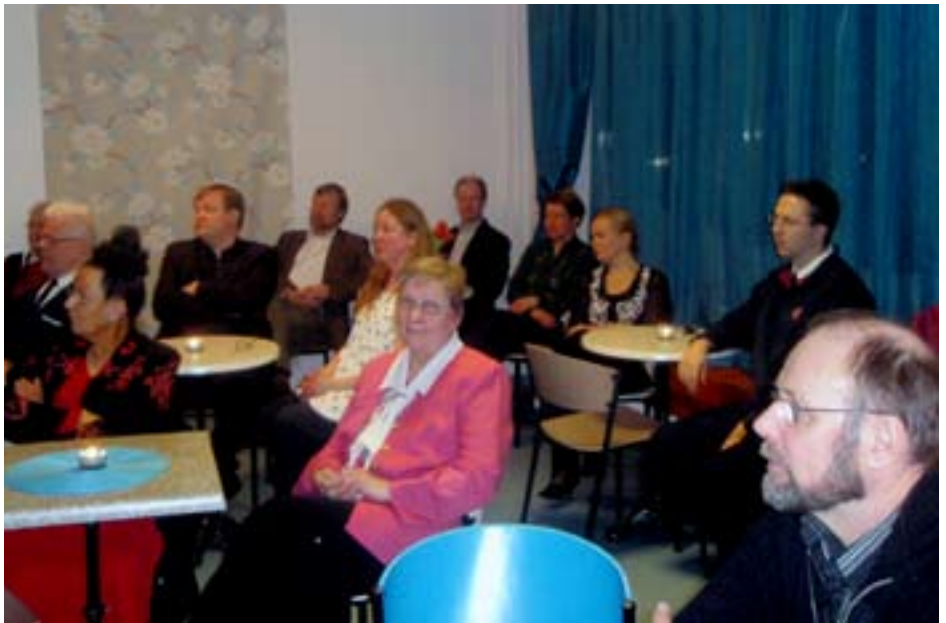
Kutsuvierasilltaan osallistui yhteensä 50 Leivän Talon ystävää.

myös kahvilan aukioloaikoina tai muina aikoina. Kahvilan toiminnan tuotto lahjoitetaan hyväntekeväisyyteen kotimaassa ja ulkomailla.