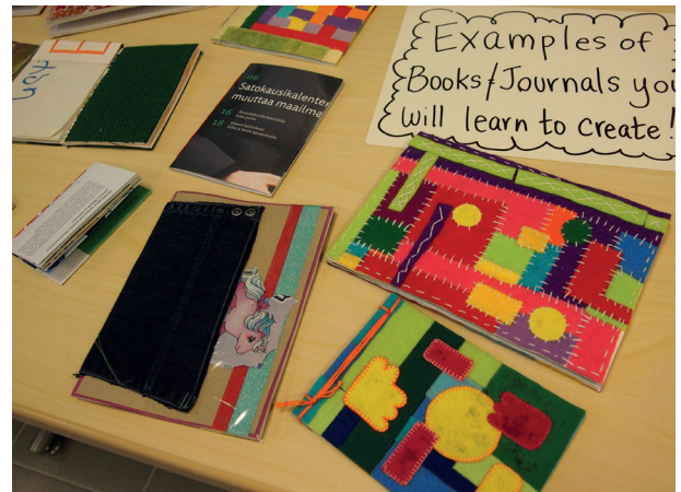
Muistikirja pajassa tuunattiin muistikirja työnhakua varten