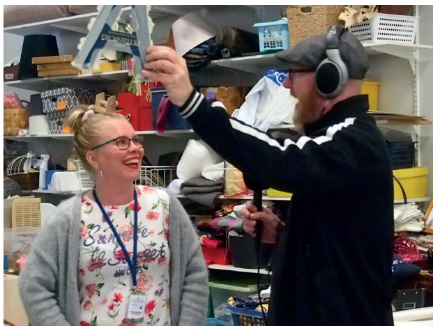
YLE Jyväskylä tutustumassa Ekotuunarin pajaan